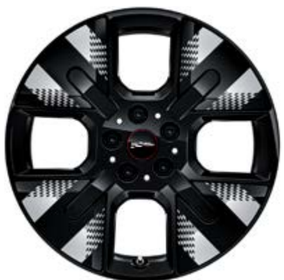
18" JCW Mastery Spoke schwarz mit Sportreifen