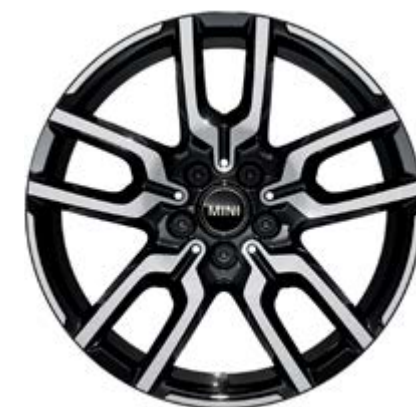
18" JCW Lap Spoke 2-Tone mit Sportreifen