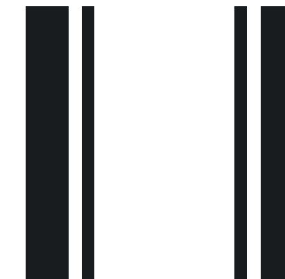
Dach in Jet Black & Sportstreifen in schwarz*