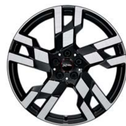
20" JCW Flag Spoke 2-Tone mit Sportreifen