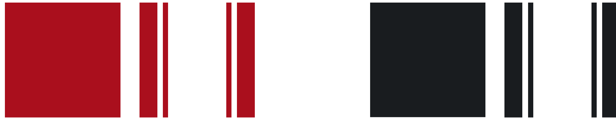
Dach in Chili Red & Sportstreifen in rot*

* Bei Bodycolor in Chili Red Sportstreifen in schwarz erhältlich