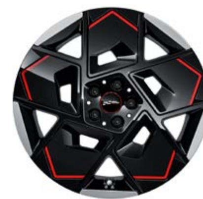
19" JCW Strive Spoke 2-Tone mit Sportreifen