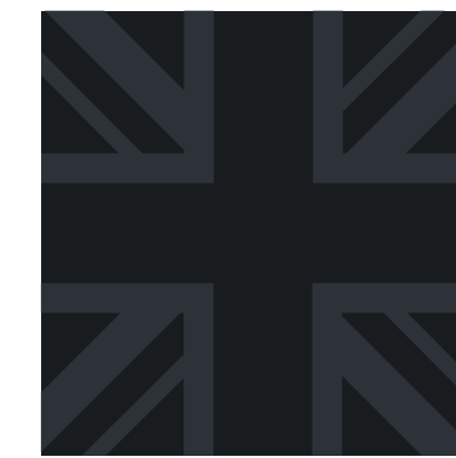
MINI Yours Verdeck*

* Bei Bodycolor in Midnight Black: Keine Sportstreifen in schwarz erhältlich &amp; Spiegelkappen = Midnight Black