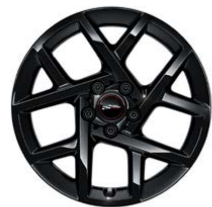
17" JCW Sprint Spoke