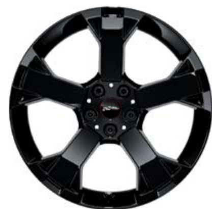
19" JCW Runway Spoke black