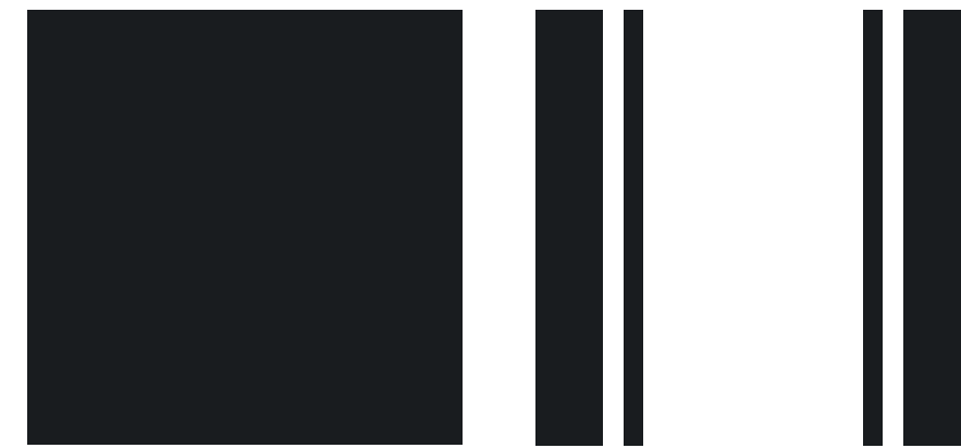
Spiegelkappen in Jet Black &amp; Sportstreifen in schwarz*

* Bei Bodycolor in Chili Red Sportstreifen in schwarz erhältlich