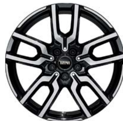
18" JCW Lap Spoke 2-Tone mit Sportreifen