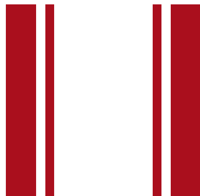
Dach in Multitone & Sportstreifen in rot*