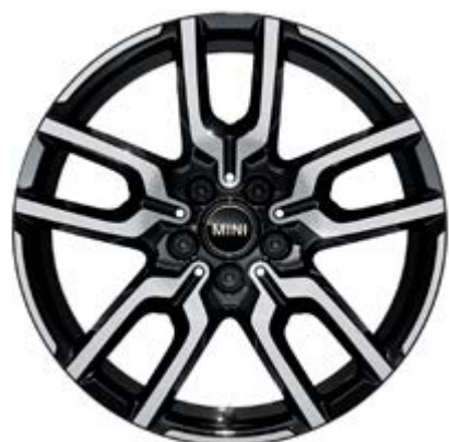
19" JCW Lap Spoke 2-Tone mit Sportreifen