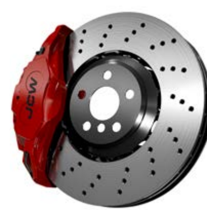
JCW Performance Bremse*