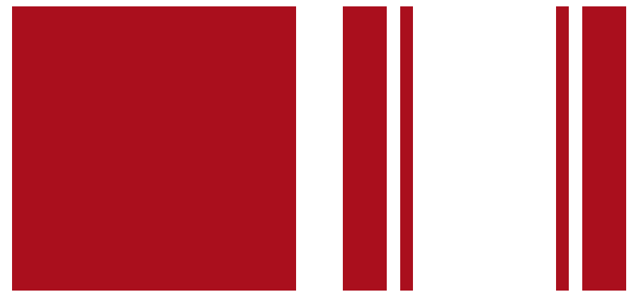
Dach in Chili Red & Sportstreifen in rot*

* Bei Bodycolor in Chili Red Sportstreifen in schwarz erhältlich