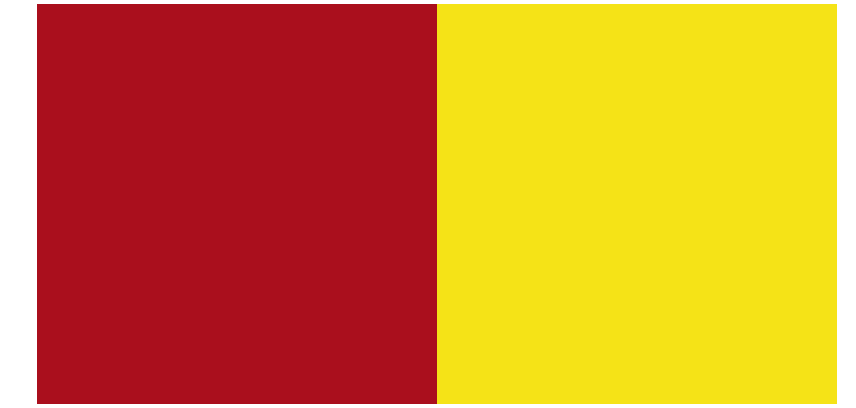
Chili Red Sunny Side Yellow